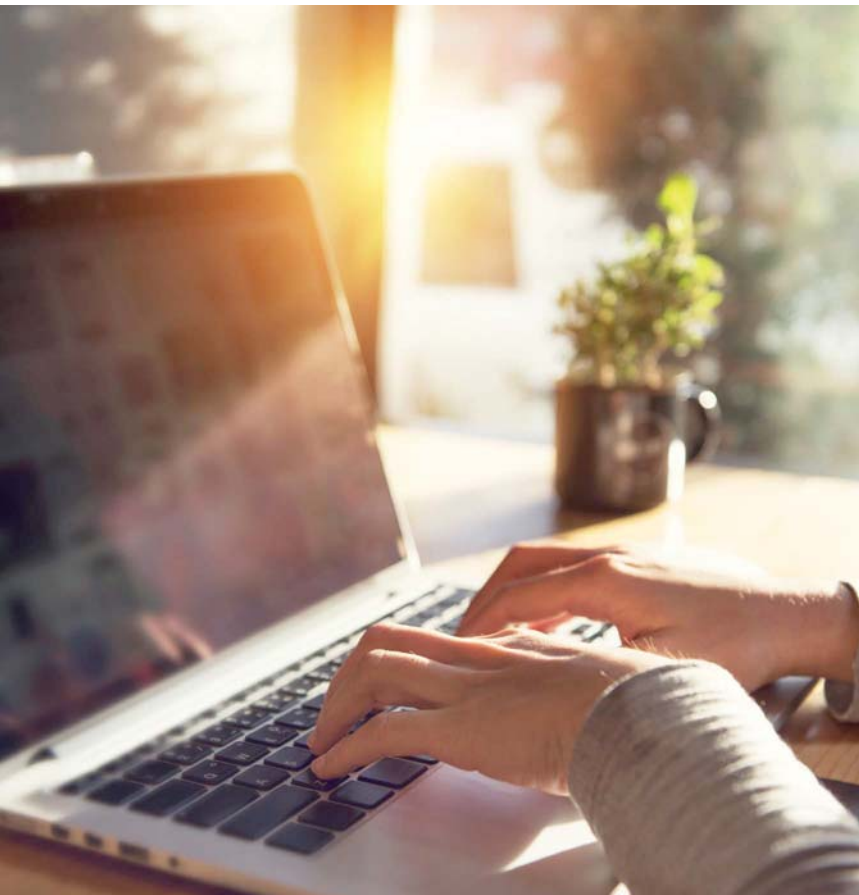
Schéma pluriannuel Covéa sur l'accessibilité numérique